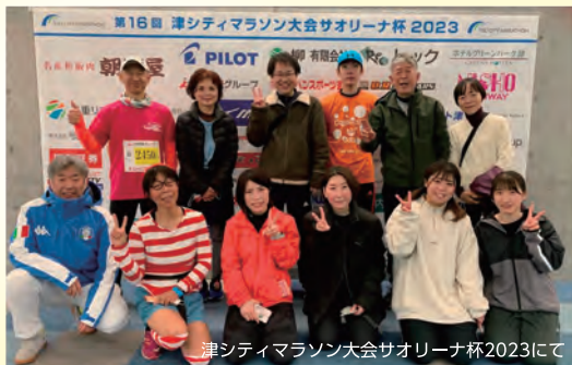
津シティマラソン大会サオーリーナ杯2023にて