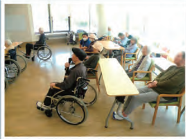
Switchを使ったカラオケ活動