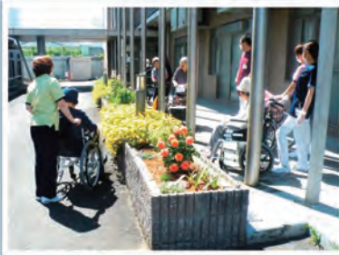
整備したガーデニングの鑑賞レクリエーション